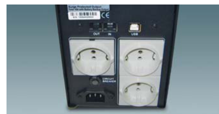
Bakstycke för IMP1025AP-1500AP.