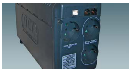
Bakstycke för IMP525AP.