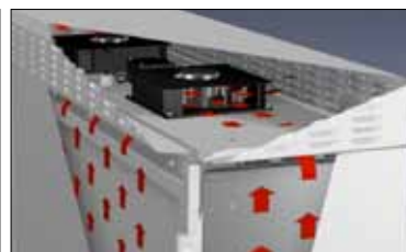
Med fläktmodul som option